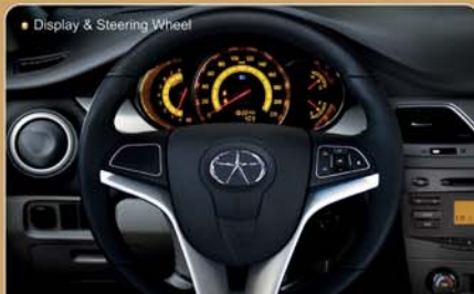
Display & Steering Wheel