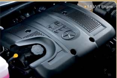
1.5 VVT Engine